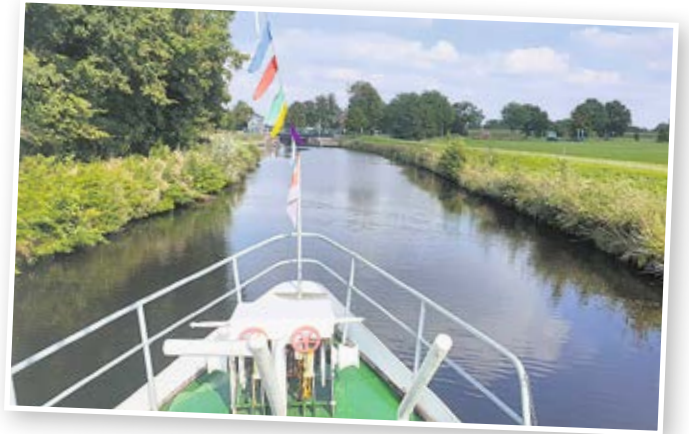
Ausflugsfahrt auf dem Ems-Jade-Kanal