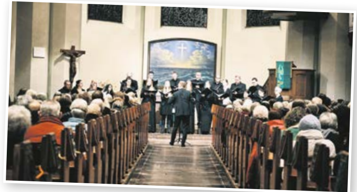
Das Abschlusskonzert von „Klassik am Meer“ in der Christus- und Garnisonkirche war ein grandioses Erlebnis. Im kommenden Jahr feiert „Klassik am Meer“ sein 20jähriges Jubiläum.