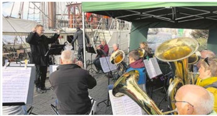
Auf dem Schiff „Artemis“ am Bontekai haben sich wieder zahlreiche Gäste eingefunden um miteinander Gottesdienst im Rahmen des WHV-Sailing-Cup zu feiern. Der Deutschlandfunk hat im Beitrag „Der Herr ist mein Lotse“ die besondere Stimmung aufgegriffen.