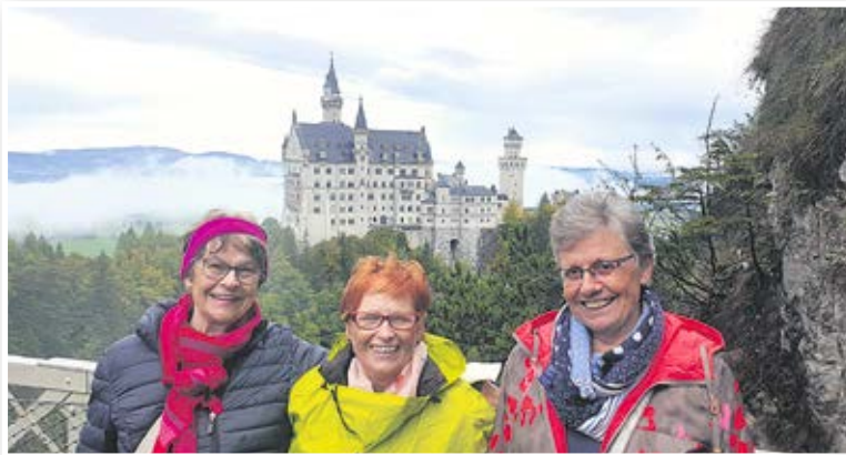
Unsere Reise zu den Passionsspielen nach Oberammergau