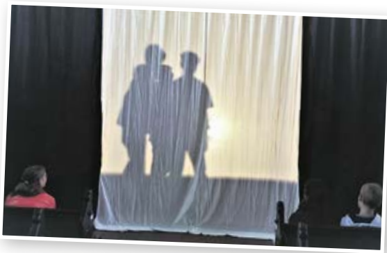
Schattenspiel der Konfis zu den zehn Geboten