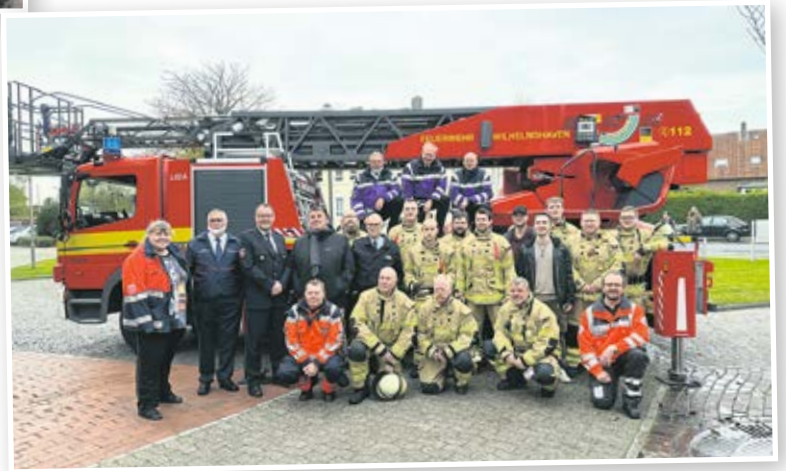
25 Jahre Notfallseelsorge Wilhelmshaven