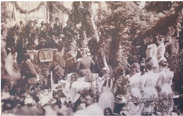
Die Zeremonie der Grundsteinlegung am 7. Juni 1899