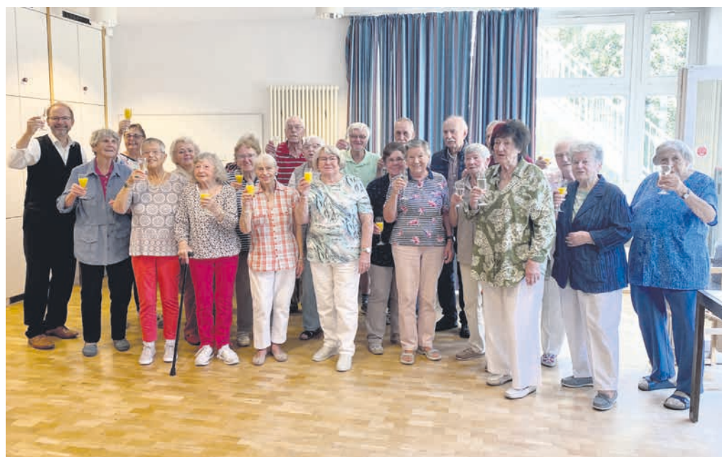
Neue immer herzlich willkommen – werden mit Sekt begrüßt!