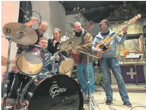
Beim „Engelsing“ hatten die Strahler ihre Premiere.