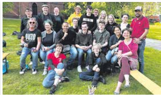
Südkiez-Fest am 27. Mai – ein superstarkes Team in der Südkiez Oase an der Christus- und Garnisonkirche