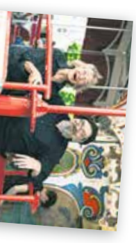
ABENDKLANG Wort und Musik am Abend in der Christus- und Garnisonkirche jeweils von 18.00 bis 18.35 Uhr