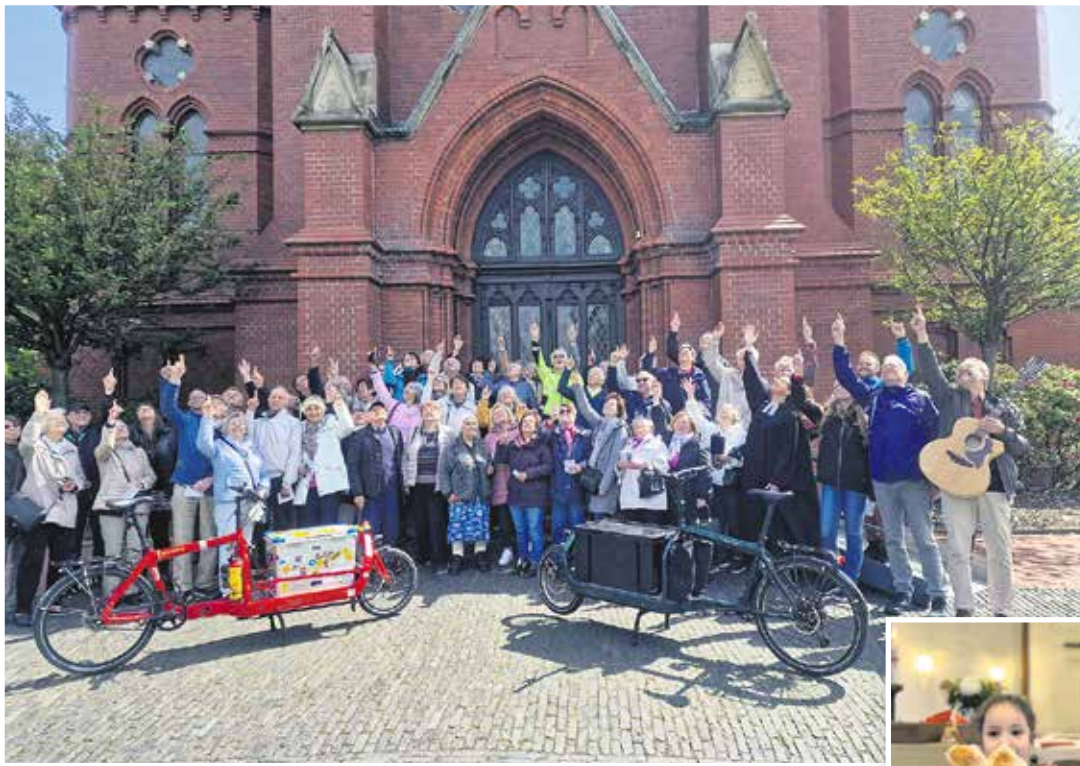
Einen schönen Himmelfahrtsgottesdienst feierten unsere Gemeinden Bant und Neuende zusammen. Vorher ging es per Fahrrad von der St. Jacobi Kirche auf Umwegen zur Banter Kirche: gemeinsam sind wir unterwegs unter Gottes weitem Himmel.