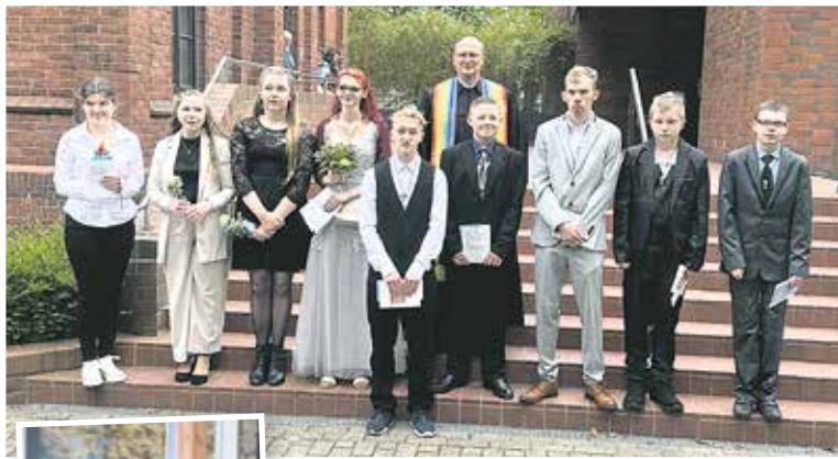
Konfirmation am 07. Mai 2023